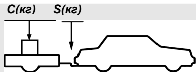
верное размещение груза