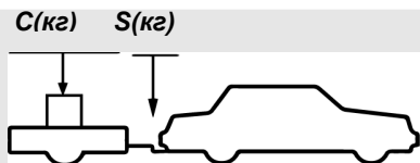
верное размещение груза